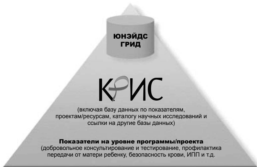
Рисунок 2. Система ГРИД

ГРИД позволяет проводить поиск данных в разных странах. Кроме того, будут максимально использоваться линии связи с другими информационными системами ООН и других стратегических партнеров.