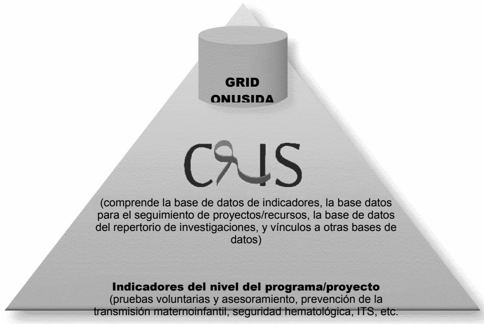
Figura 2. El sistema GRID

La GRID permitirá búsquedas de datos en otros países. También potenciará los vínculos con otros sistemas de información del sistema de las Naciones Unidas y otros asociados estratégicos.